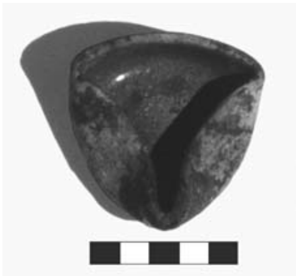
Fig. 5 - Bobbio, collezione privata. Lucerna a vasca aperta rinvenuta nell'ambito di un nucleo funerario presso il “ponte Gobbo”.

in parte associabili ad età post-classica 11 (Fig. 5), la Vita di S. Colombano e dei suoi discepoli , composta dal monaco bobbiese Giona