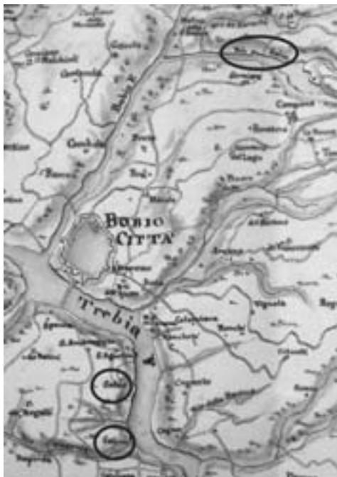
Fig. 3 - Archivio di Stato di Torino, Corte, Paesi di nuovo acquisto, Bobbiese , m. 1, doc. 21, Carta topografica del contado di Bobbio ... (Onofrio Mugnozzi, Milano, 15 gennaio 1744), autorizzazione [prot. n. 4516/28.28.00 del 19 luglio 2011].