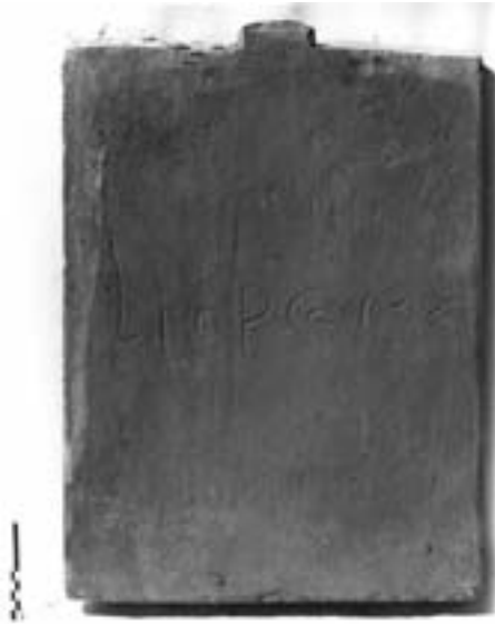
Fig. 9 - Bobbio, Casa canonica di S. Colombano. Laterizio altomedievale iscritto.