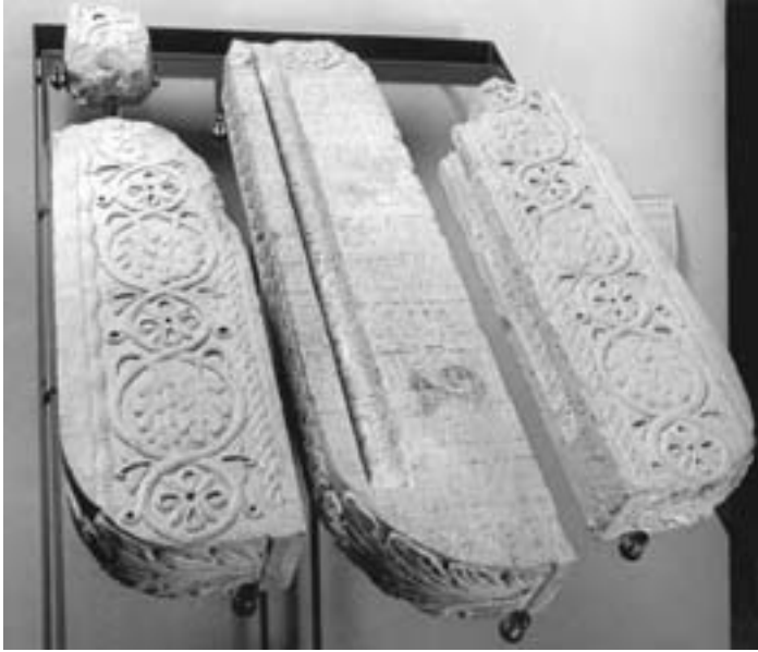
Fig. 8 - Bobbio, Museo dell'Abbazia. Lastra funeraria iscritta (secolo VIII).