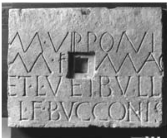
Fig. 4 - Bobbio, Museo dell'Abbazia. Iscrizione di età repubblicana ed imperiale con la possibile menzione di un magister.