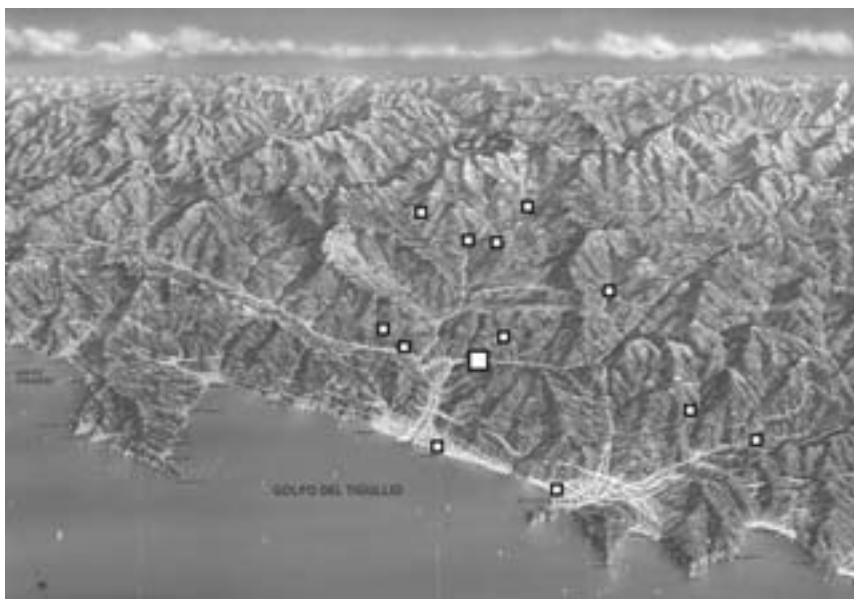
Fig. 10 - Il monastero di Graveglia (quadrato grande) nel quadro dei possedimenti liguri bobbiesi (quadrati piccoli) secondo il Breviarium della fine del X secolo-inizi XI (base cartografica APT Tigullio).

te nel Levante (Fig. 10) 51 , in relazione a quei nuclei fondiari già presenti nella documentazione carolingia del cenobio ed in parte organizzati in cellae 52 .